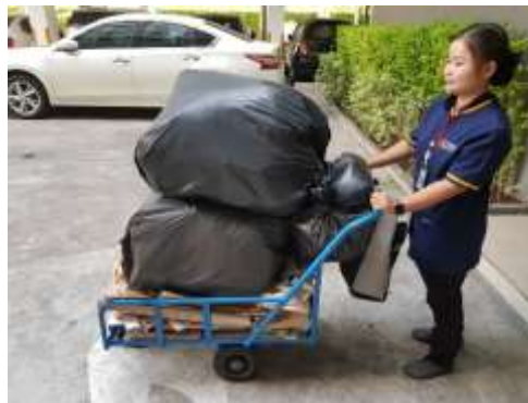
รูปที่ 7 การจัดการมูลฝอย (ต่อ)