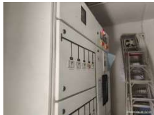
รูปที่ 9 ระบบไฟฟ้า