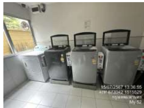
รูปที่ 12 เครื่องใช้ไฟฟ้าแบบประหยัดพลังงาน