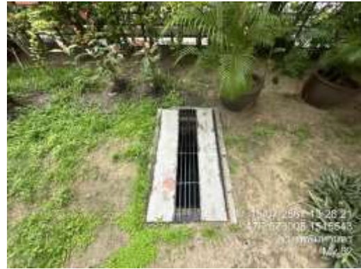
รูปที่ 6 ระบบบำบัดน้ำเสีย (ต่อ)