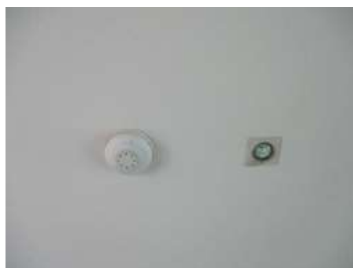
รูปที่ 15 ระบบป้องกัน และระบบเตือนอัคคีภัย (ต่อ)