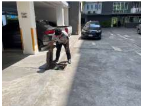
รูปที่ 20 เจ้าหน้าที่ตรวจสอบและทำความสะอาดท่อระบายน้ำ