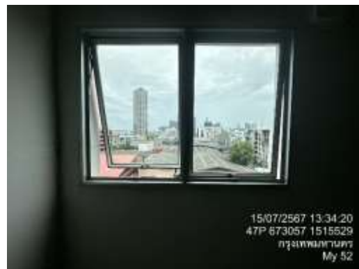
รูปที่ 8 ระบบระบายอากาศธรรมชาติ