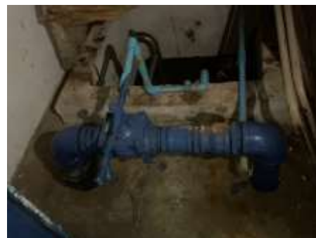
รูปที่ 13 ถังสำรองน้ำใช้ชั้นดาดฟ้า/ชั้นใต้ดิน