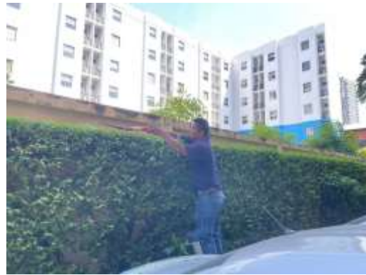
รูปที่ 3 คนสวนดูแลพื้นที่สีเขียวของโครงการ