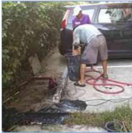
รูปที่ 20 เจ้าหน้าที่ตรวจสอบและทำความสะอาดท่อระบายน้ำ (ต่อ)