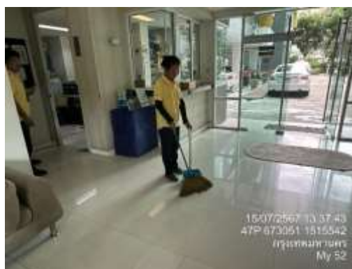
รูปที่ 2 พนักงานทำความสะอาดพื้นที่ส่วนกลาง