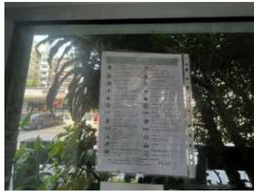
รูปที่ 11 การประชาสัมพันธ์ และการรณรงค์ (ต่อ)