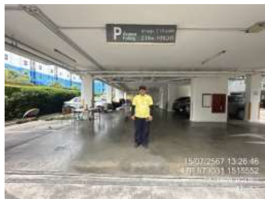
รูปที่ 4 ด้านการจราจร