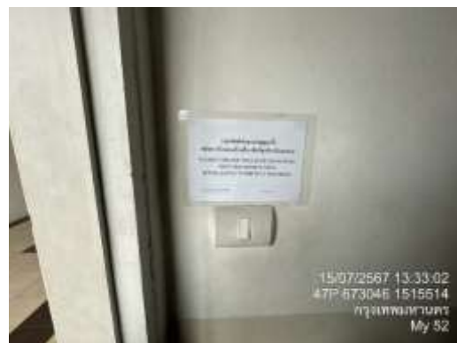
รูปที่ 11 การประชาสัมพันธ์ และการรณรงค์