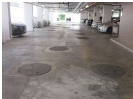
รูปที่ 6 ระบบบำบัดน้ำเสีย