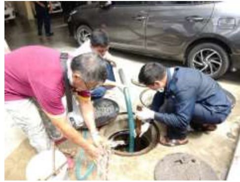
รูปที่ 17 เจ้าหน้าที่สูบลากตะกอน