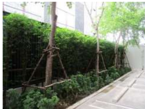
รูปที่ 1 พื้นที่สีเขียวของโครงการ