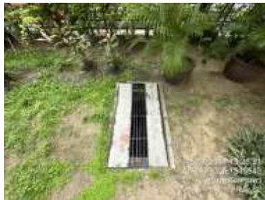
รูปที่ 19 บ่อหน่งน้ำ