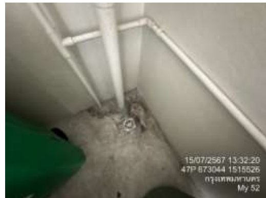
รูปที่ 7 การจัดการมูลฝอย