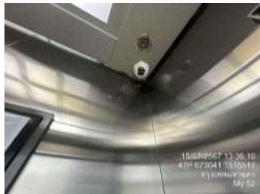
รูปที่ 14 ระบบ CCTV