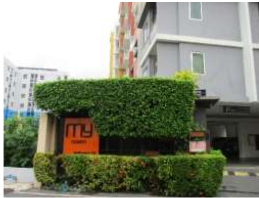
รูปที่ 10 ป้ายชื่อโครงการ