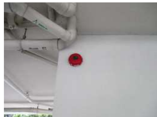
รูปที่ 15 ระบบป้องกัน และระบบเตือนอัคคีภัย