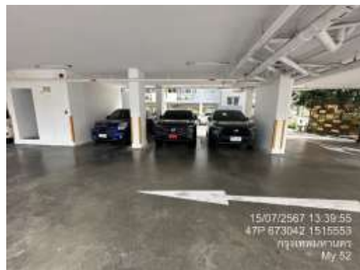
รูปที่ 5 ที่จอดรถ