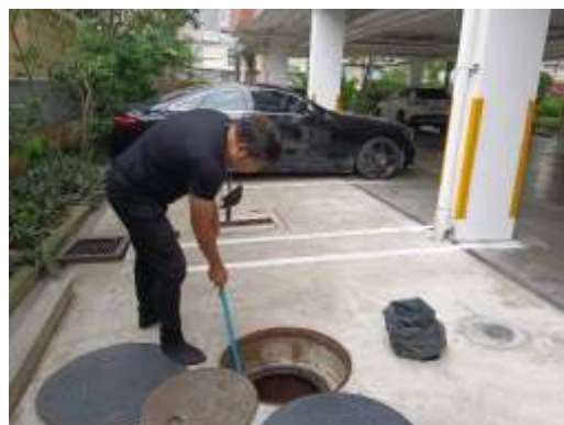
รูปที่ 16 เจ้าหน้าที่ตัดไขมัน